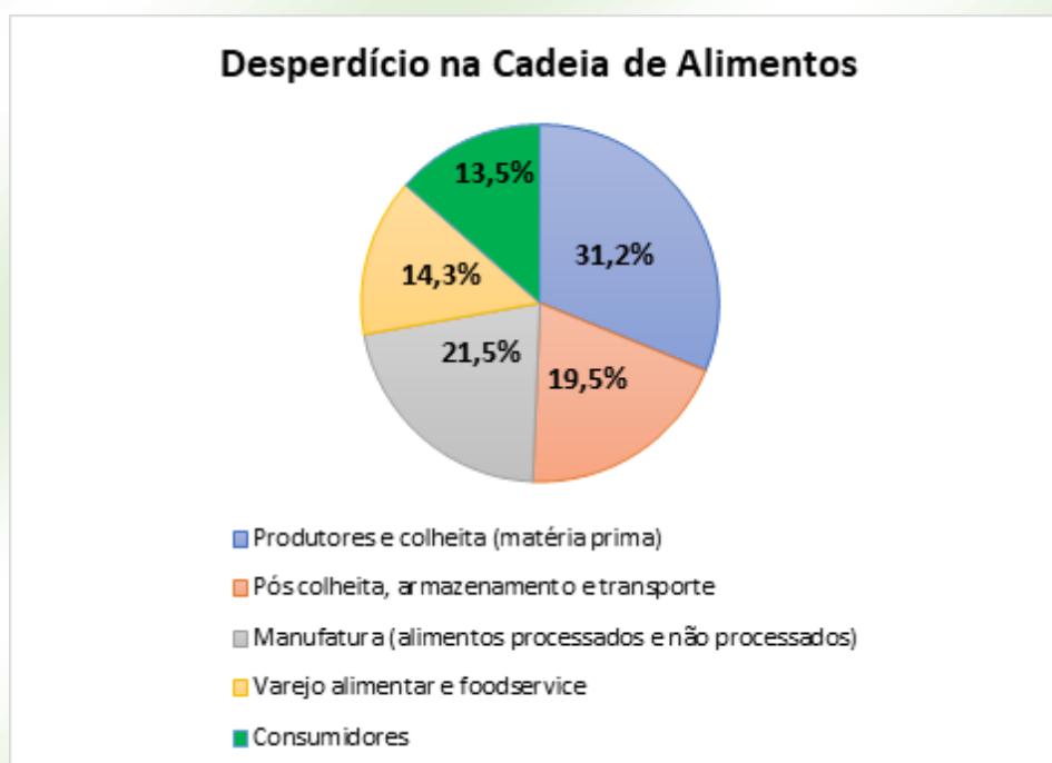
Figura 1. Percentual de desperdício de alimentos na cadeia de produção e abastecimento.

A primeira questão analisada foi o desperdício na cadeia de alimentos, onde verificou-se as seguintes etapas do processo: Produtores e colheita (matéria prima); pós-colheita, armazenamento e transporte; manufatura (alimentos processados e não processados); Varejo alimentar e food service; e consumidores. Na Figura 1, pode-se observar que 31,2 % do desperdício de alimentos ocorre na primeira etapa da cadeia de produção e abastecimento, a saber: produtores e colheita. Sendo necessário melhorar e investir nas práticas agrícolas.